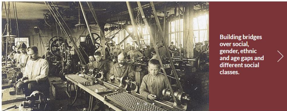
VIRTUAL REALITY ARCHIVE LEARNING (ViRAL)